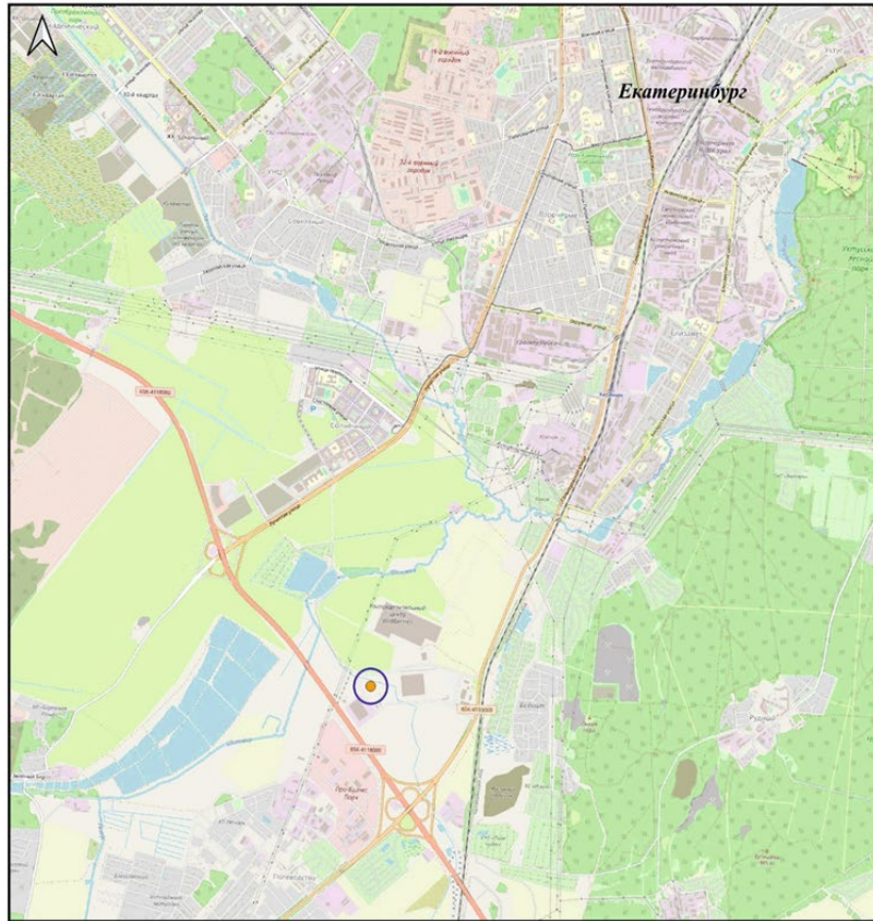
Схема участка недр ООО «Завод ЖБИ-7», расположенного по адресу: Свердловская область, г. Екатеринбург, Орджоникидзевский район, ул. Фронтовых Бригад, д. 15